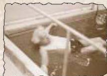
Ben Gurion wusste was gut ist (60er Jahre)