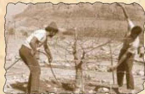
Heute der "Größte" (Affenbrotbaum 1971)

Dem enormen Pioniergeist der Gründergeneration Ein Gedi's - die heute um die 70 Jahre jung ist - sowie ihrer Weitsicht ist es zu verdanken, dass wir Euch heute an diesem wunderschönen, bequem zu erreichenden Fleckchen Erde begrüßen dürfen. Die Zukunft Ein Gedes mit all den Ungewissheiten, den vielfältigen wirtschaftlichen, politischen, demographischen und ökologischen Problemen kann nur auf der Basis von Kenntnis und Vergegenwärtigung der Vergangenheit gestaltet werden.