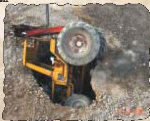
Die Natur rächt sich