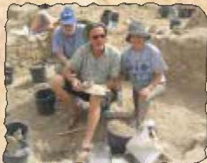
Fleißige Helfer bei der Arbeit

Einen Monat im Jahr (Januar/Februar) verlässt er seine Arbeit als Kibbutzschlosser und wird zum Vollblutarchäologen - wenn es die finanzielle Situation zulässt. Während die Wichtigkeit und Qualität der Fundstätte unumstritten ist, fließen staatliche Fördergelder eher spärlich.