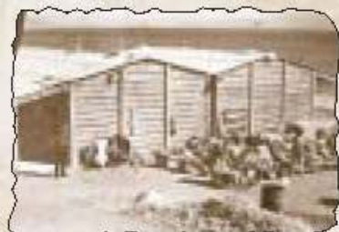
Ein Gedi SPA! (60er Jahre)

In Ein Gedi ist vieles anders - ohne daß es uns immer bewusst ist. Durch den direkten, persönlichen Kontakt können wir auf Eure individuellen Wünsche eingehen. Der direkte Kontakt zu Mitarbeitern und Kibbutzanwohnern ist nicht nur unvermeidbar, sondern erwünscht und ermöglicht Euch den direkten Einblick in unsere Lebenswelt - mit all ihren Besonderheiten und Problemen. Sonnenkollektoren auf den Dächern der Gästezimmer und Kibbutzhäuser, „Car Sharing“ und Zentral-Wäscherei schonen wir Ressourcen, das Gästehaus-Schwimmbad steht auch allen Anwohnern offen, ihr seid als Gäste wiederum zu Feiern und Aktivitäten der Kibbutzgemeinde eingeladen. All diese Dinge sind für uns "Einheimische" fast selbstverständlich - und machen doch den Urlaub zu einem besonderen Erlebnis. Wer bei uns zu Gast ist, weiß, daß die lokale Bevölkerung direkt von seinem Aufenthalt profitiert und diese sich andererseits dem verantwortungsvollen Umgang mit natürlichen Ressourcen verpflichtet fühlt. Das bedeutet einen Qualitätsgewinn für beide Seiten.