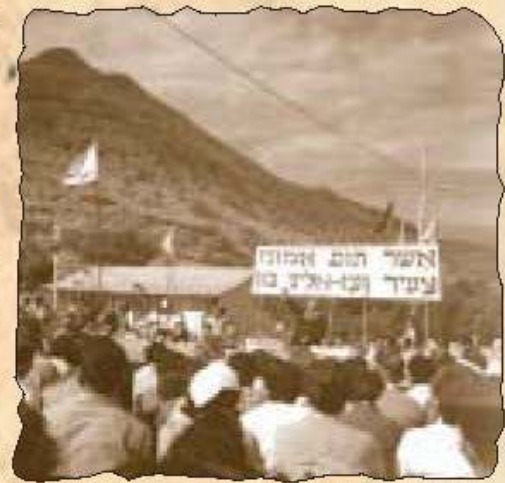
Gründungszeremonie: 10. Januar 1956

der Ein Gedi Newsletter kommt in diesem Jahr verspätet bei Euch an. Das liegt daran, dass wir mit einem solchen Gäste-Ansturm, wie er bereits im März begann und sich bis dato fortsetzt, einfach nicht gerechnet haben. Wir, d.h. das gesamte Gästehaus-Team, hatten alle Hände voll zu tun, uns auf die neue / alte Situation einzustellen. Ein schönes Geschenk zum Jubiläum! Unser Kibbutz besteht nunmehr seit 50 Jahren, allen widrigen Umständen zum Trotz. Alles begann am 10. Januar 1956, als entschieden wurde das Experiment zu wagen, einen Kibbutz zu gründen, der die Jahrtausende alte jüdische Siedlungstradition wieder aufleben lässt: Eingekeilt zwischen hohen Bergen im Westen, dem Meer im Osten, sowie der unmittelbar anliegenden jordanischen Grenze im Norden war Ein Gedi vor 50 Jahren das „Ende der Welt“. Die einzige Verbindung zur Außenwelt war eine unbequeme und gefährliche Schotterpiste gen Süden, eine Tagesreise entfernt von Be'er-Sheba.