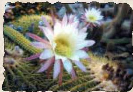
Nach einer königlichen Nacht ist alles vorbei