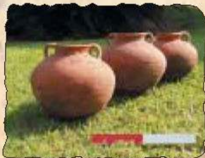
Einige Fundstücke der Saison 2006