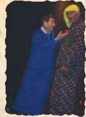
... Rochik: Das Publikum ist begeistert!