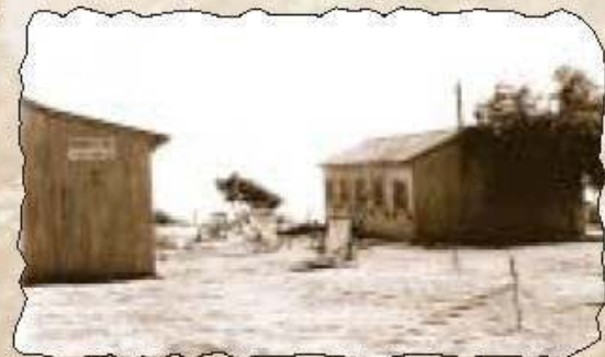
Einfach komfortabel: Unser Gästehaus 1962

Dem enormen Pioniergeist der Gründergeneration Ein Gedi's - die heute um die 70 Jahre jung ist - sowie ihrer Weitsicht ist es zu verdanken, dass wir Euch heute an diesem wunderschönen, bequem zu erreichenden Fleckchen Erde begrüßen dürfen. Die Zukunft Ein Gedes mit all den Ungewissheiten, den vielfältigen wirtschaftlichen, politischen, demographischen und ökologischen Problemen kann nur auf der Basis von Kenntnis und Vergegenwärtigung der Vergangenheit gestaltet werden.