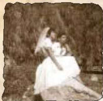
Hochzeit im Davidstal (1961)

Reisen zu „exotischen“ Zielen boomen. Immer mehr Touristen reisen in fremde Länder, finden sich aber in abgeschotteten Traumwelten wieder. Begegnungen mit der fremden Kultur finden, wenn überhaupt, nur in organisierter Form statt, ein beiderseitiger belebender Austausch mit der anderen Kultur findet in der Regel nicht statt. Das Geld der Touristen kommt der lokalen Bevölkerung oft nicht zu Gute, sondern fließt anschließend wieder aus den Ländern hinaus, da die Hotels oft internationalen Ketten angehören.