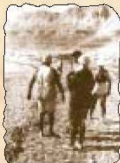
Erste Urlauber suchen ihr Heil im Schlamm

Reisen zu „exotischen“ Zielen boomen. Immer mehr Touristen reisen in fremde Länder, finden sich aber in abgeschotteten Traumwelten wieder. Begegnungen mit der fremden Kultur finden, wenn überhaupt, nur in organisierter Form statt, ein beiderseitiger belebender Austausch mit der anderen Kultur findet in der Regel nicht statt. Das Geld der Touristen kommt der lokalen Bevölkerung oft nicht zu Gute, sondern fließt anschließend wieder aus den Ländern hinaus, da die Hotels oft internationalen Ketten angehören.