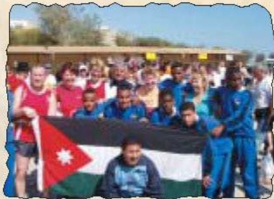
Friedliches Miteinander: Deutsche, jordanische & israelische Läufer

Internationaler Halbmarathon, Internationaler Handbike-Halbmarathon, Offene israelische Straßenmeisterschaft über 10 km, offene israelische Walking-Strassenmeisterschaft über 10 km, 3 km - Volkslauf, 2 km Junioren-Lauf. Für die Zeit des Laufs haben wir ein spezielles "Sportler-Paket" geschmürt. Wer neugierig geworden ist, kann sich bei uns informieren.